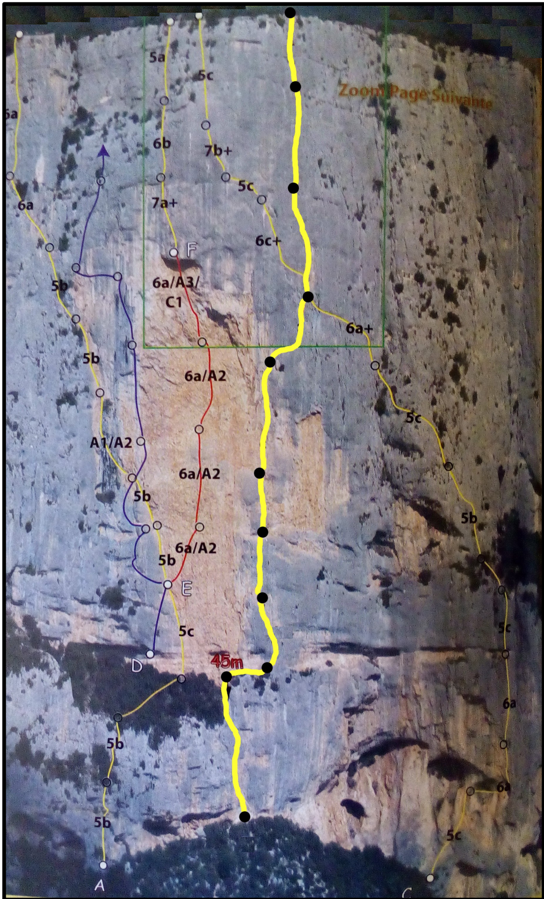
Il tracciato della via