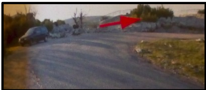
Accesso alle calate